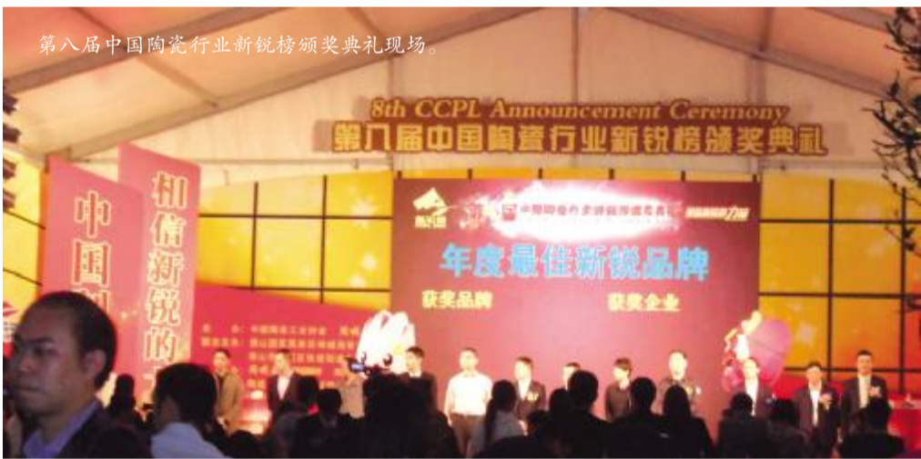
第八届中国陶瓷行业新锐榜颁奖典礼现场。

——热烈祝贺嘉利雅磁砖被中国陶瓷工业协会、《陶城报》联合授予“年度新锐品牌”荣誉称号